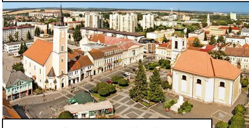
Rimavská Sobota, kaštieľ Betliar

3x ubytovanie v centre Košíc, 3 x raňajky, sprievodcovské služby, doprava